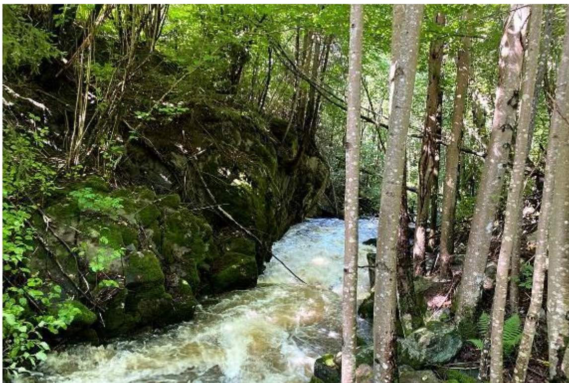
Tussebekken i Nordre Follo kommune.