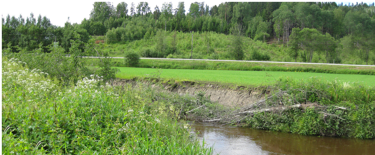
Etter hugst av trær (linjerydding fra e-verk) i en strekning på 10 meter langs dette vassdraget raste ca. 30 tonn jord ut i elva.