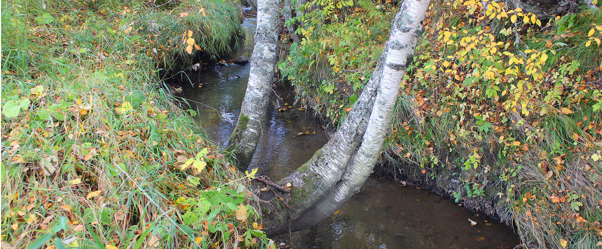
Gamle trær som henger over bekken er gunstig for fisk, men når trærne dør vil de velte og rive opp kanten. Fra Skibekken