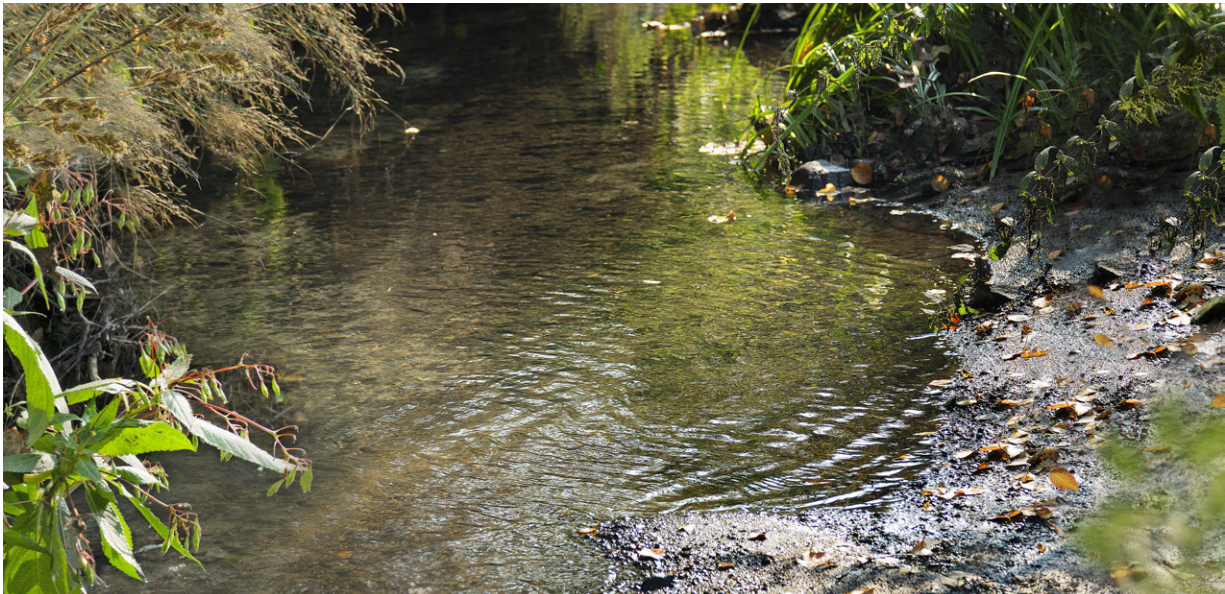
Vannet graver langs kant i Skibekken.