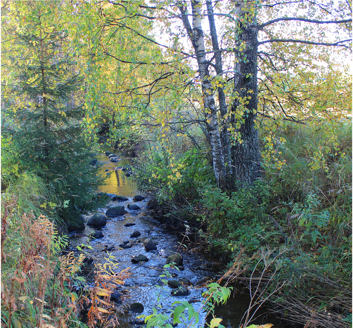
Område langs Skibekken med behov for vegetasjonspleie.