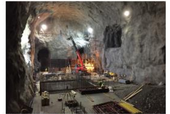
Foto: Bedre vann er et mål. © 2017 for utførelsen ved vår blanding av vann og kloakk.

Tilstandsvurdering av kommunale vann- og avløpstjenester