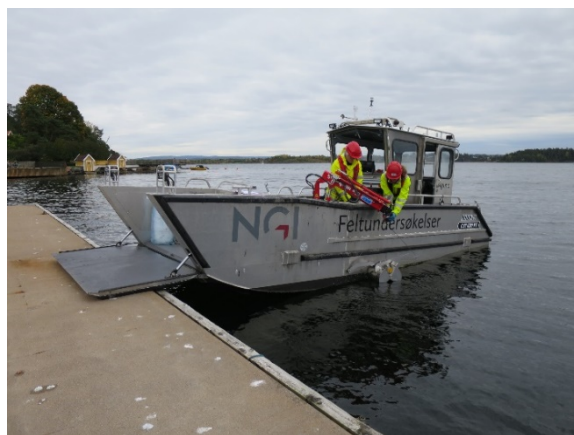
Prøvetaking av sedimenter fra NGIs feltbåt F/F Kolstad.

NGI har ikke undersøkt områdene i Oslo Havn som var omfattet av den store miljøoppryddingen som ble avsluttet i 2011. I disse områdene har andre undersøkelser vist at miljøtilstanden er betydelig forbedret, selv om det også er tegn til at det kommer forurensning fra land som legger seg oppå den nye sjøbunnen som er etablert.