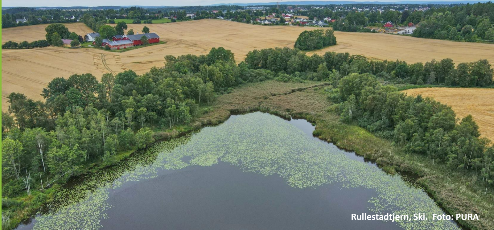
Rullestadtjern, Ski.