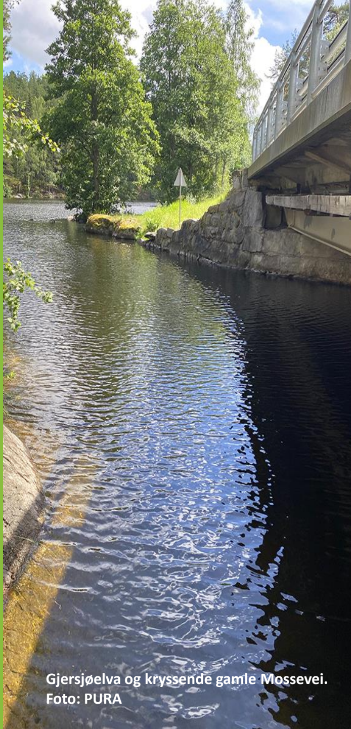
Gjersjøelva og kryssende gamle Mossevei.