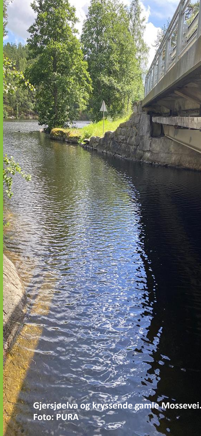
Gjersjøelva og kryssende gamle Mossevei.