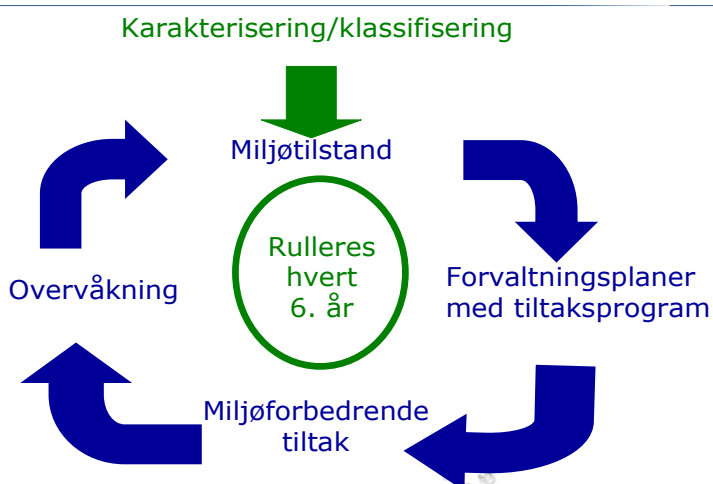
Figur 1. Planhjulet for gjennomføring av vannforskriften.

Arbeidet med å oppfylle vannmiljømålene er delt inn i faser på seks år. Figur 1 viser planhjulet for gjennomføring av vannforskriften og sentrale oppgaver som skal gjennomføres i hver fase.