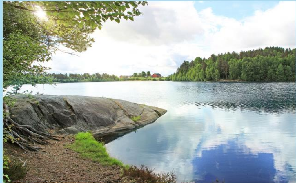
Oppegårdtjern i Frogn kommune.