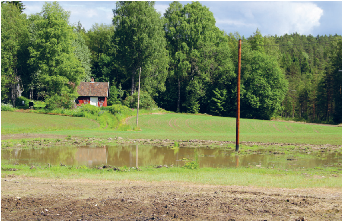
I PURA er det et særlig fokus på tiltak i landbruket. Bilde tatt like ved Nærevann.

Hovedutfordringen i vannforekomstene i PURA er tilførsel av næringsstoffer, spesielt fosfor, som gir økt algevekst. I Kolbotnvann og Årungen er det problemer med oppblomstring av giftproduserende blågrønnalger (cyanobakterier). For å oppnå målene om god økologisk og kjemisk tilstand iht. vannforskriften er det viktig å gjennomføre gode tiltak. Fosfor er det viktigste algebegrensende næringsstoffet i ferskvannsføremønstrene og det er tiltak som reduserer forførselen til vann som må vektlegges.