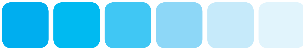
100% full farge 80% tint 60% tint 40% tint 20% tint 10% tint