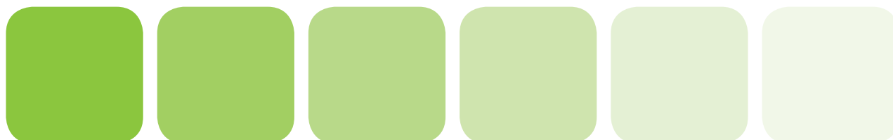
100% full farge 80% tint 60% tint 40% tint 20% tint 10% tint