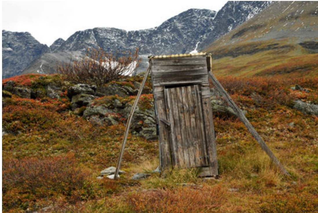
Utedo på Rastebyfjellet i Nord-Troms